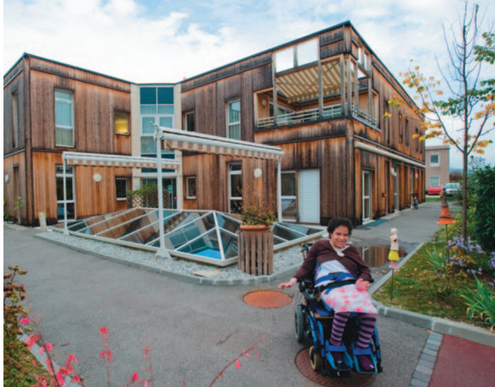
Foyer de vie « Le Goéland », Meythet (74).