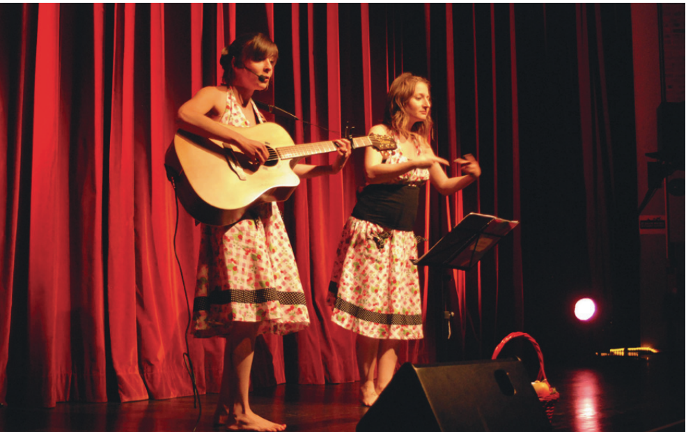
« Bon appétit », spectacle bilingue en français oral et LSF produit par Vice et Versa.