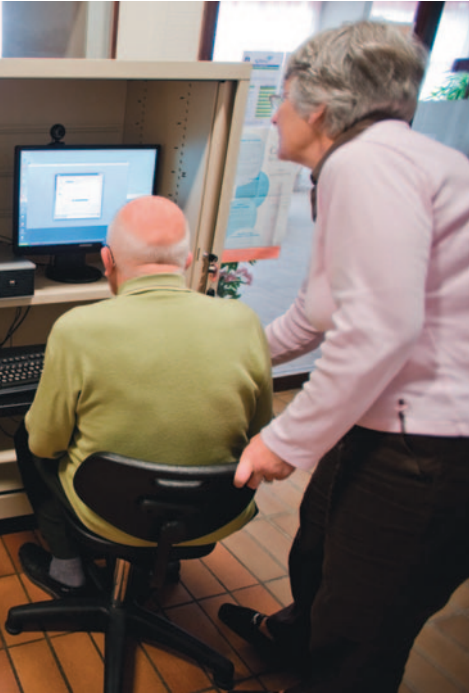
Cyberespace de l'établissement d'hébergement pour personnes âgées dépendantes « La Résidence heureuse », Annecy (74).