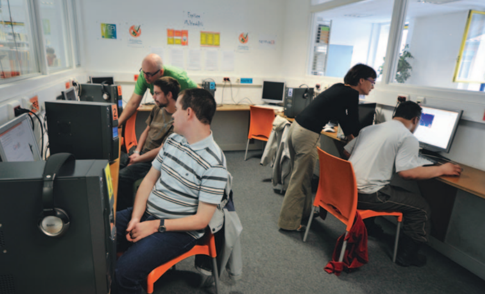
Le Bocal, espace Internet de la Médiathèque Simone de Beauvoir, Romans-sur-Isère (26).