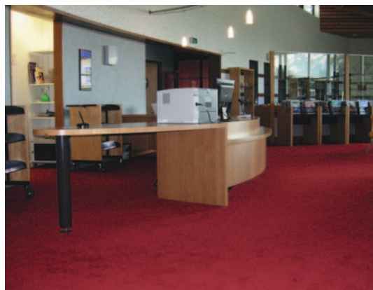
Banque de prêt à la Bibliothèque de Saint-Pierre-en-Faucigny (74).

L'accueil est un moment privilégié pour informer et accompagner l'ensemble des usagers de la bibliothèque. Certaines bibliothèques ont un espace dédié à l'accueil, d'autres non. S'il existe, il doit répondre à des normes très précises quant à la hauteur de la banque d'accueil, l'éclairage, la diversité des systèmes d'information (visuelle, sonore), etc.