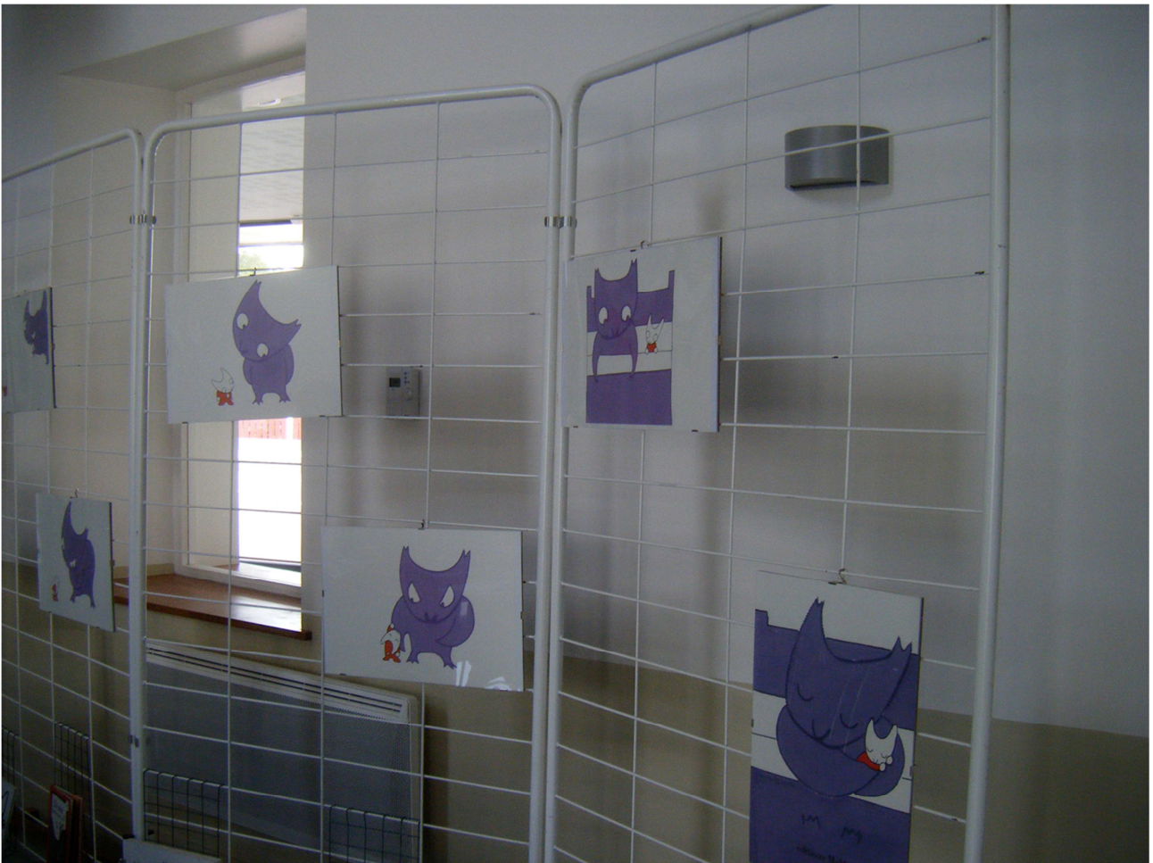
Exposition Ton cauchemar à la bibliothèque de Logron

- Ou débiter la lecture des 2 albums dans l'espace lecture puis jouer à retrouver les illustrations des albums parmi les illustrations de l'exposition.