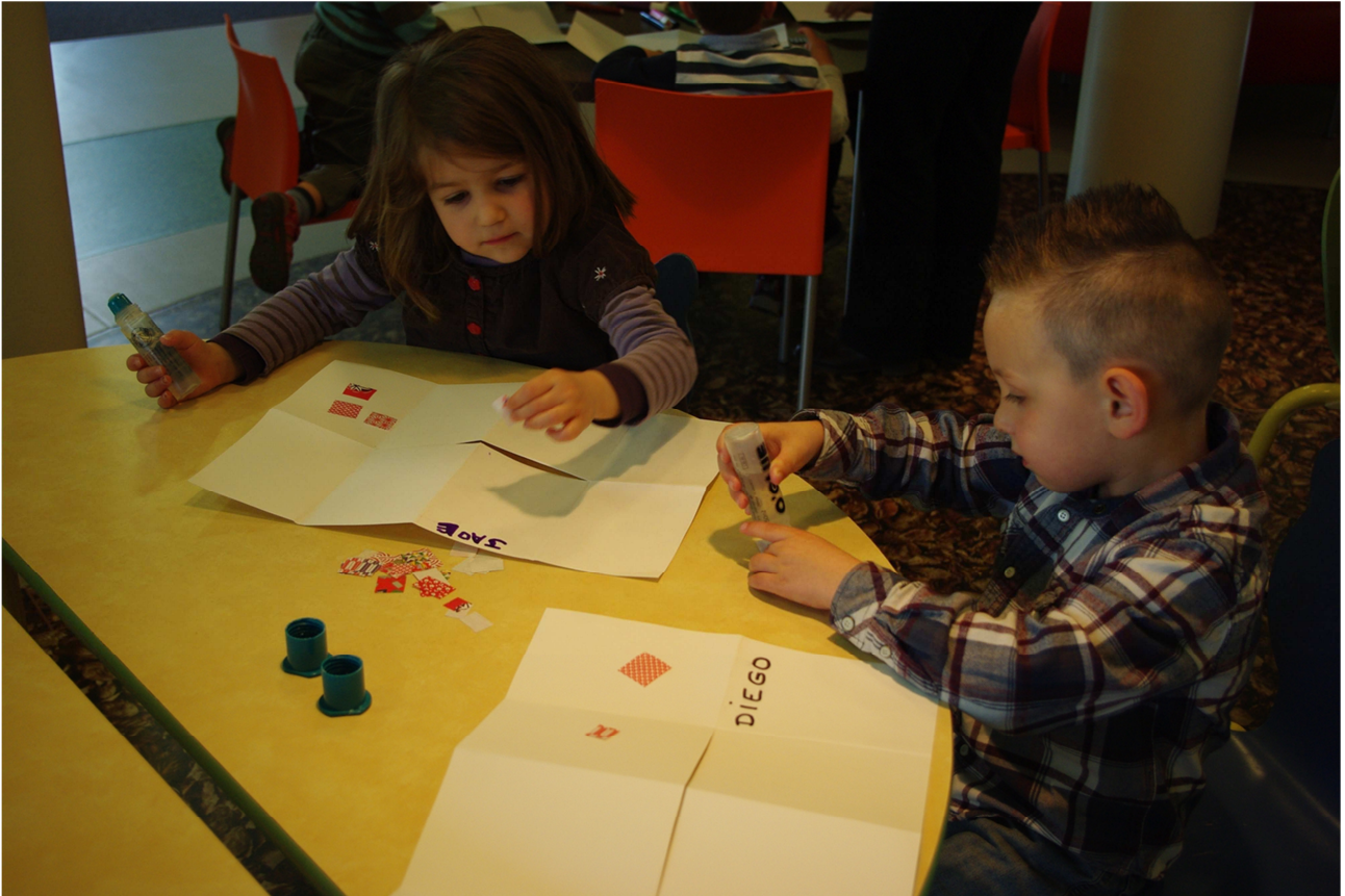
Atelier avec une classe de petits moyens à Cloyes

Jouer avec le livre « le livre-puzzle de la poule (et du renard!) »